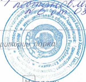
Схема благоустройства территории парка

Примечание № 3 к проекту благоустройства территории парка 03.03.2019